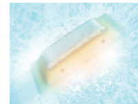
◀ サファイアチップ採用